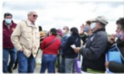
TIJUANA. En el lugar el gobernador inspecciona que se sigan la cadena para garantizar la seguridad a adultos mayores.

El Estado supera ya los 254 mil adultos mayores vacunados con el virus una dosis