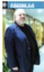
RODRÍGUEZ CALDERÓN RODRÍGUEZ CALDERÓN