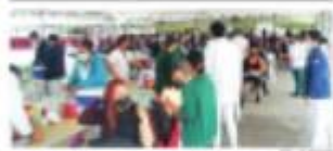
MEXCALI. En la instalaciones de PAN se observó, desde las 8 de la mañana, una gran afluencia de personas para recibir la primera dosis de la vacuna una dosis.