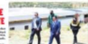
TIJUANA. La UABC y la UABC supervisaron la construcción de la "Prepa" Militar de Tecate.

TECATE. El gobernador de Baja California, Jaime Rodríguez Calderón, supervisó la construcción de la "Prepa" Militar de Tecate, en la que se aplicó la primera dosis de la vacuna una dosis.